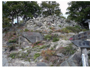
感状山城跡 (国指定史跡)