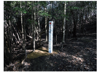
宿禰塚古墳(造出付円墳) (市指定史跡)