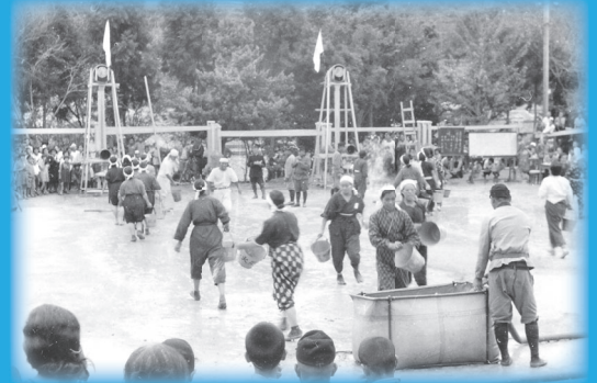
防空バケツリレー（相生小学校校庭）1943年